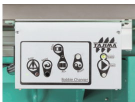
簡単操作のコントローラー

SBCは簡単メンテナンス SBCは必須機能を絞り込んだシンプル設計でコンパクト。安定した動作で、ボビンを確実にセットします。面倒な注油は不要です。